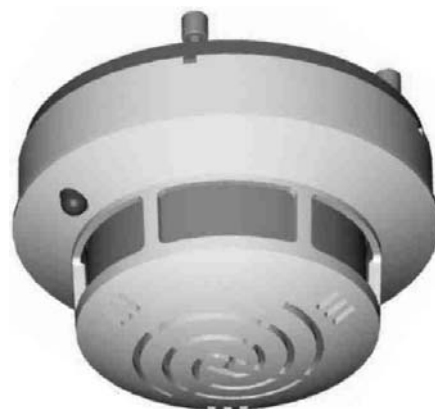
Fig. 1 SSD 515-xS

Le SSD 515-xS est vendu dans quatre sensibilités : voir Caractéristiques techniques.